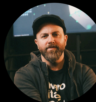
OSCAR LAMA PRODUCTORA MUSICAL

“Fueron jornadas con mucha información, mucho intercambio de conocimiento entre pares. Esto junto a la experiencia que tiene el equipo de Omni, sobre cómo se han ido desarrollando en el trabajo de Atmos, fue muy valioso”